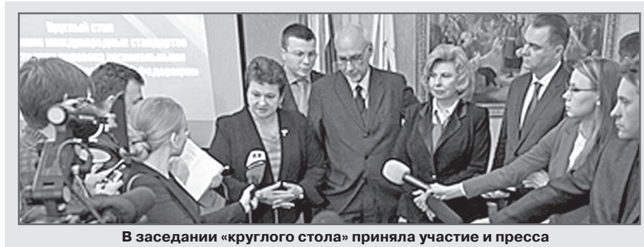
В заседании «круглого стола» приняла участие и пресса

В Суздале прошёл «круглый стол» на тему «Применение международных стандартов в области прав человека региональными уполномоченными в Российской Федерации».